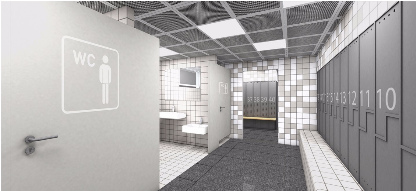
— Vue intérieure vestiaires type B