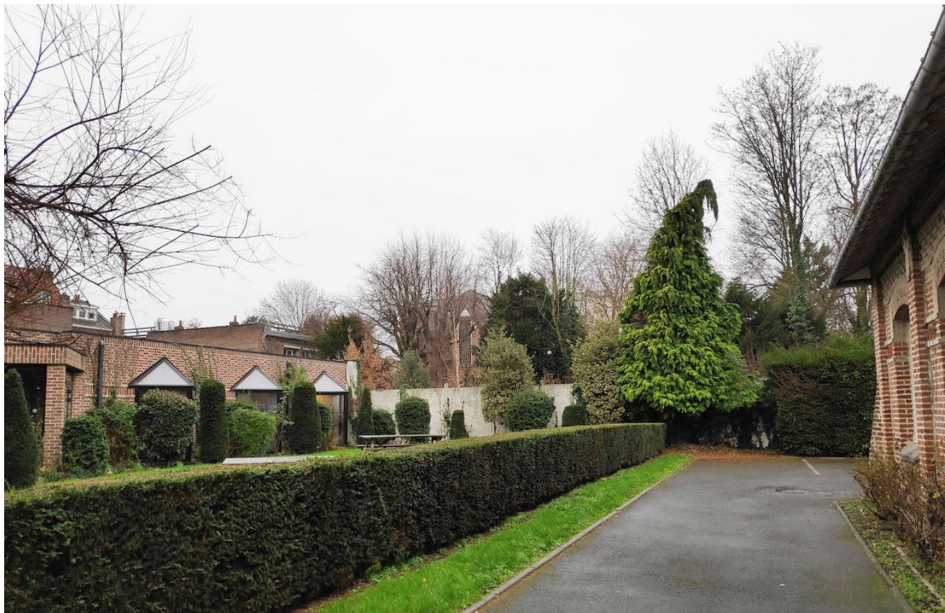
— L'implantation du nouveau bâtiment orientera les bureaux vers le jardin planté et le coeur de parcelle