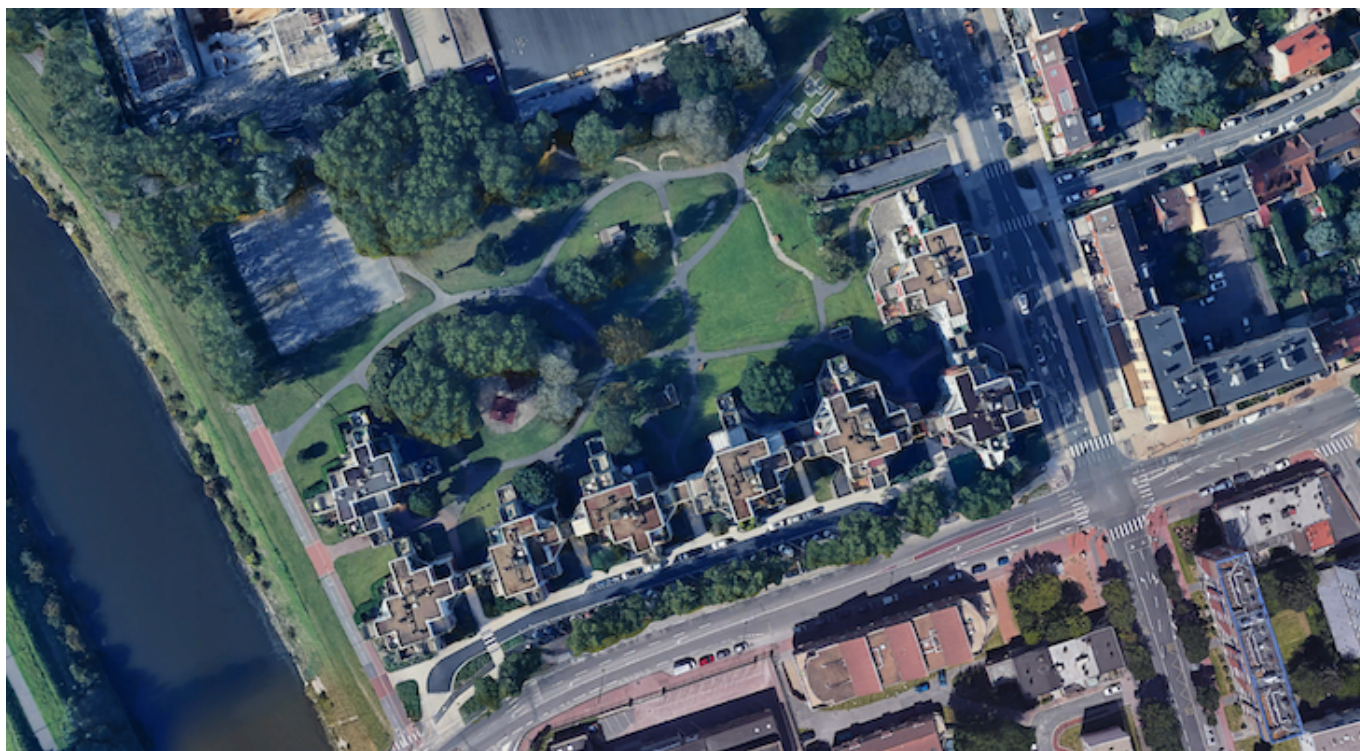
— Vue aérienne du site de l'opération avenue de la Libération à Dunkerque