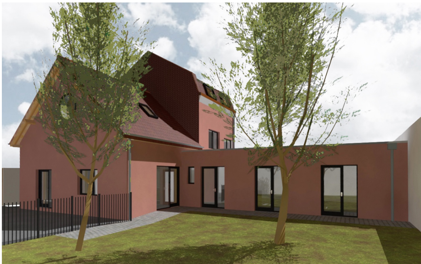
— Vue de la micro-crèche implantée autour du jardin