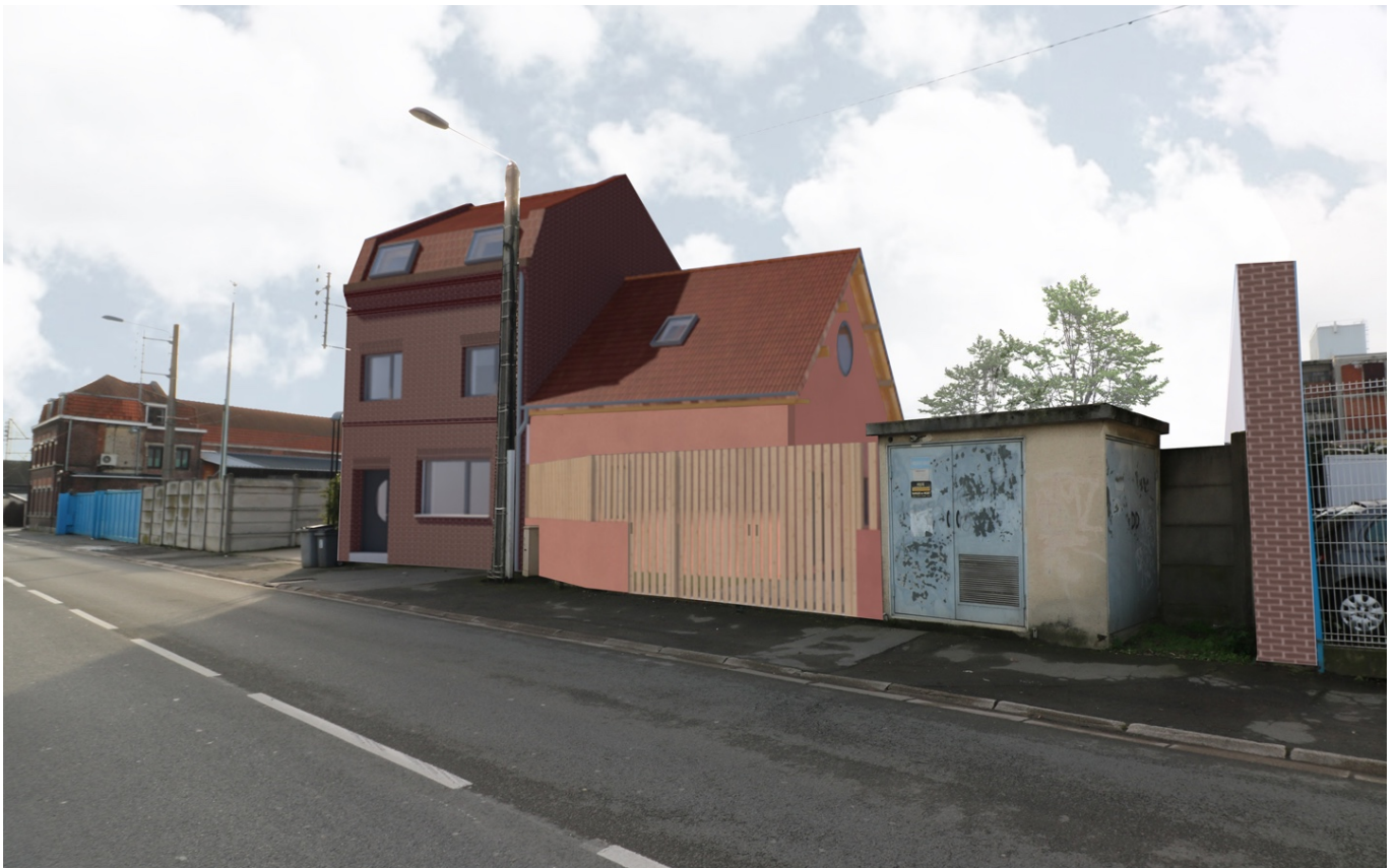
— Vue du logement et de l'entrée de l'équipement depuis la rue

Ce projet de l'association Haut comme 3 pommes prend place dans un bâtiment existant composé d'un corps de bâti principal et de deux extensions. Il se propose de réhabiliter le bâtiment d'une part logement de type T3 en rez-de-chaussée, R+1, R+2 et cave ; d'autre part en micro-crèche en rez-de-chaussée et R+1 implantée dans les constructions existantes et dans une nouvelle extension.