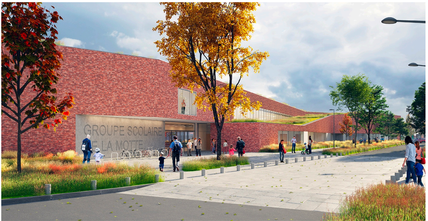
— Perspective parvis

La ville de Lesquin souhaite poursuivre sa dynamique de restructuration des équipements dédiés à la jeunesse en implantant un nouveau groupe scolaire dans le quartier de la Motte. Bordé par le village historique à l'Est, l'autoroute à l'Ouest, et l'aéroport au Sud, ce quartier en pleine mutation ne semble pas solidaire du reste de la commune. Outre une connexion à l'échelle de la ville, l'école de la Motte permet l'unification au sein même d'un quartier aujourd'hui scindé en deux par un axe automobile : d'une part, un tissu résidentiel lâche en mutation, d'autre part, une ZAC en développement et une plaine sportive au grand potentiel. Au bord d'une avenue redéfinie de manière à obtenir un espace public de qualité et favorisant les circulations douces, l'équipement polyvalent devient un signal offrant une cohérence au maillage urbain morcelé. La superposition aux limites du terrain côté avenue inspire sa taille et sa forme particulière. Si l'aspect extérieur évoque un entrelacement, le vécu intérieur associe fluidité, liaison et transparence.