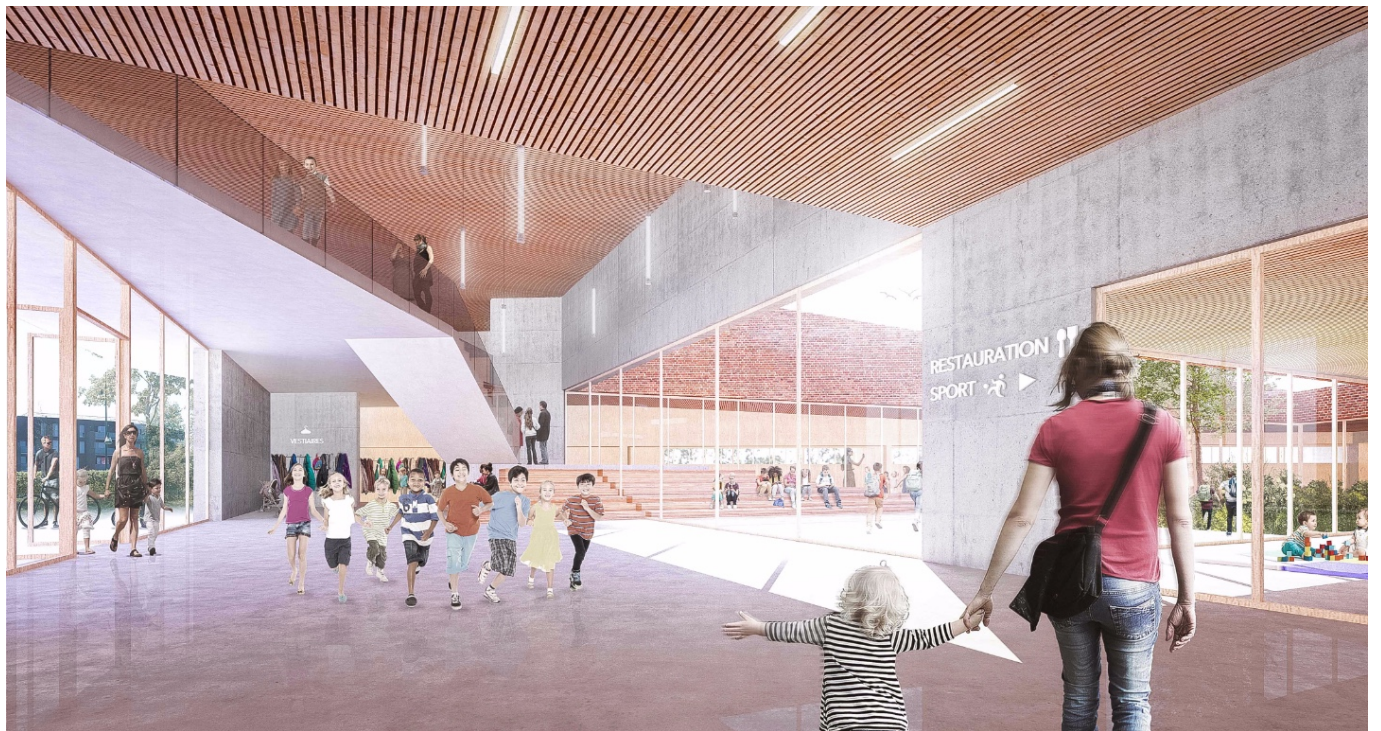
— Perspective hall