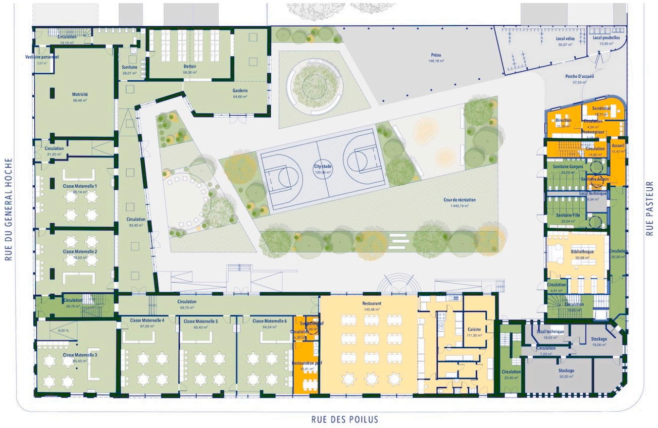
— Plan du rez-de-chaussée : déplacement de l'entrée du site