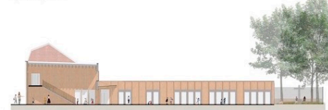
Coupe sur porche_1/200