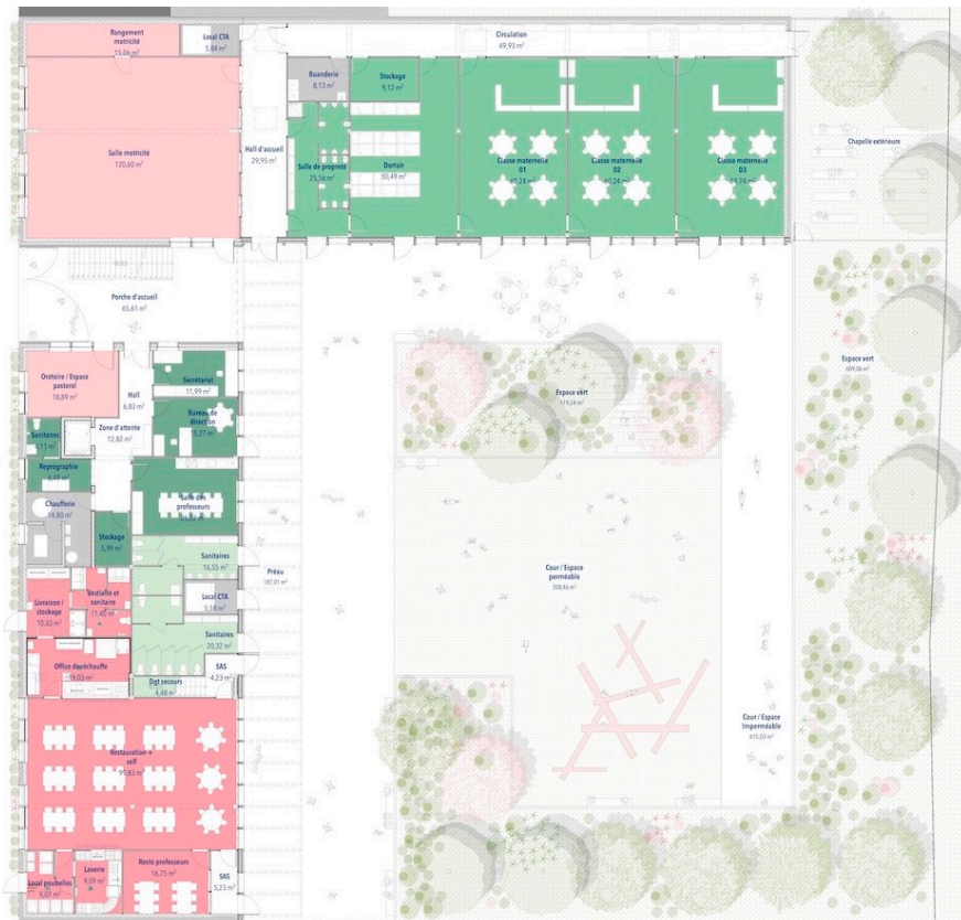
Plan de rez-de-chaussée 1/100