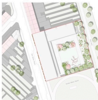
Plan masse 1/500