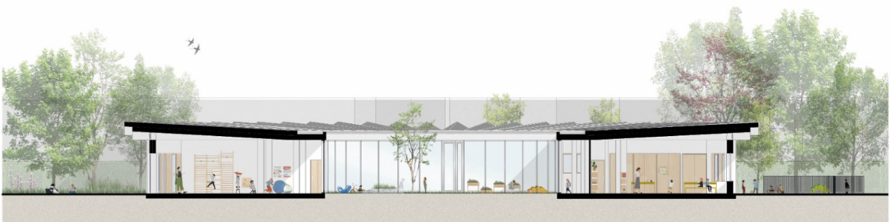
— Coupes projetées sur le patio