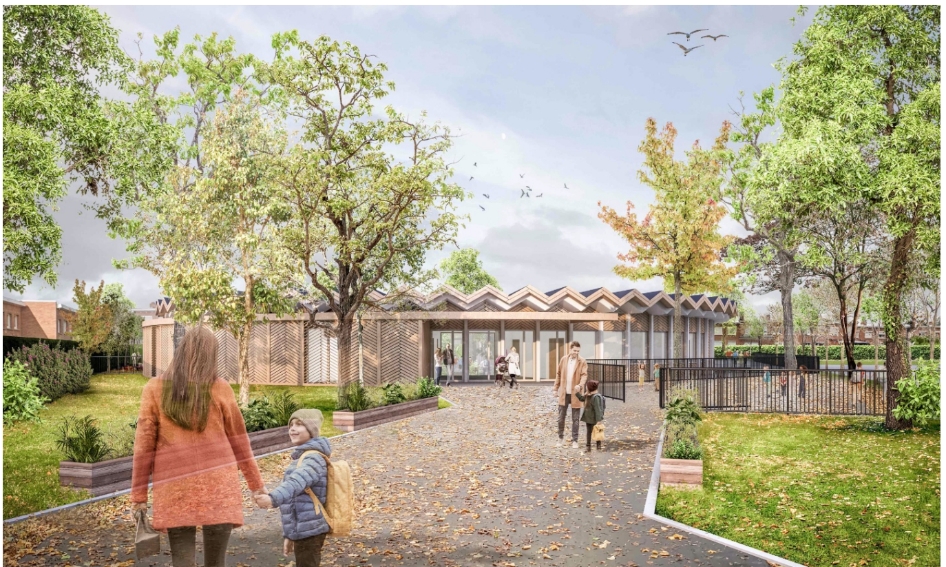
— Vue perspective du projet depuis l'entrée de l'école