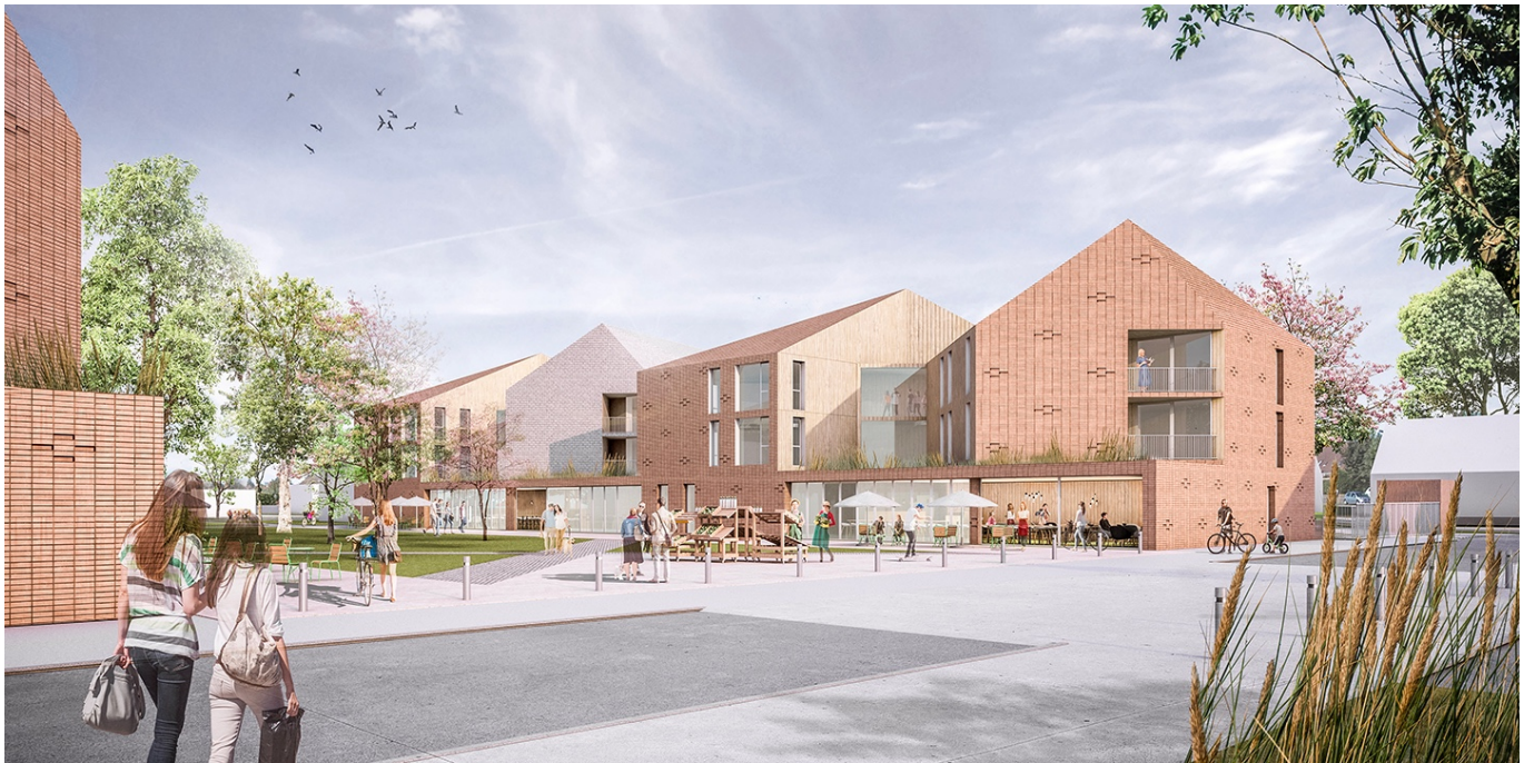
— La place du village bordée de commerces de proximité